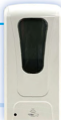
ハンドセンサー 除菌用ディスペンサー