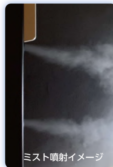
ミスト噴射イメージ